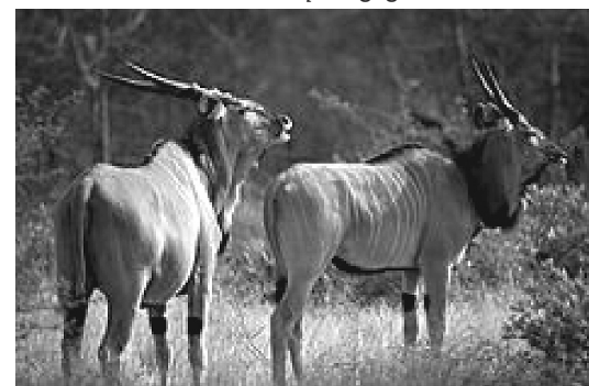
Antilopa Derbyho získala svůj název podle Edwarda Smith-Stanleye, 13. hraběte z Derby, který ve své době vynikal jako vášnivý průzkumník zvířat a jeho potomek také spolupracuje s o.s. Derbianus.