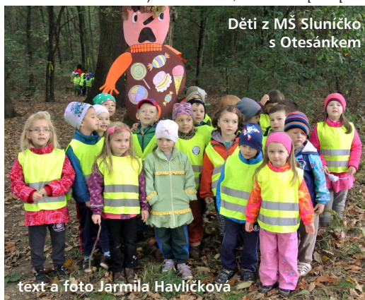
Děti z MŠ Sluníčko s Otesánkem

A na závěr nás Otesánek všechny obdaroval, jak jinak – samozřejmě zdravou odměnou.