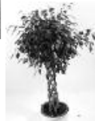
Ficus benjamina Fíkovník malolistý

zelenec chocholatý, kořenokvětka vyšší, kamélie a další.