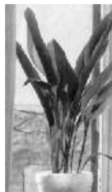
Aspidistra Kořenokvětka Domácí štěstí Ševcovská palma

Z venku se podíváme do bytů, kde pěstujeme pokojevé květiny , které by neměly chybět ani v ložnici . Při výběru květin do ložnice se vyhneme příliš aromatickým jedovatým a chlupatým druhům jako je difenbachie a pryšec – vánoční hvězda. Zeleň ložnici, zkrášluje zvyšuje vlhkost, snižuje koncentraci jedů a mikrobů. V noci nespotřebují květiny mnoho kyslíku, takže spáčkům nechybí. Vhodné květiny do ložnice jsou fíkusy benjaminy, lipěnky africké,