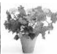
Sparmannia africana Lipěnka africká Pokojevá lipka