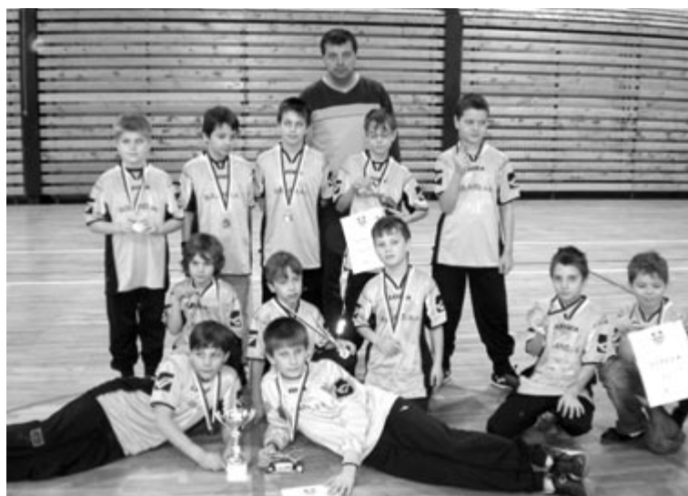
Obrázek z vyhlášení výsledků – náš stříbrný tým

Velké poděkování všem hráčům starší přípravy FK Újezd nad Lesy za předvedené výkony v průběhu celého zimního turnaje a také jejich rodičům, bez jejichž nezištné podpory a ochoty při zabezpečení organizace celého turnaje bychom nebyli schopni takový turnaj uspořádat. Díky !!