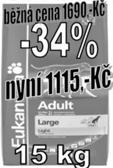
Eukanuba LB Adult dospělý pes velká plemena

Otevírací doba: pondělí - pátek - 8.30-18.00 hod.