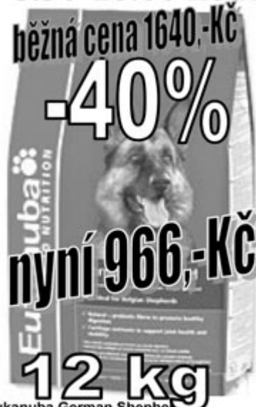
Eukanuba German Shepherd Německý ovčák-dospělý pes

Vynikající hrudkující stelivo světlé barvy s mimořádnými absorbčními vlastnostmi a s perfektní protizápachovou molekulární klapkou, určené především pro kočky a fretky.