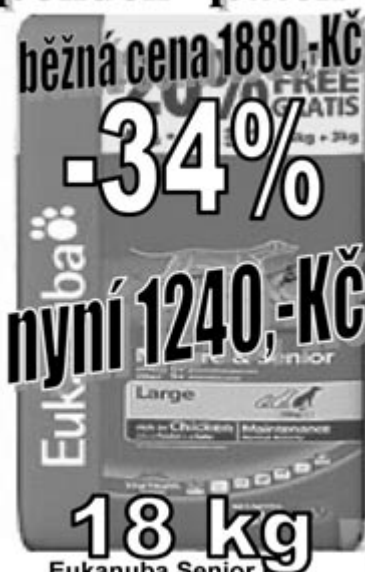
Eukanuba Senior starší pes velká plemena