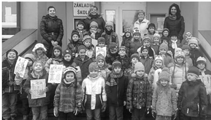
Mateřská škola Sluníčko