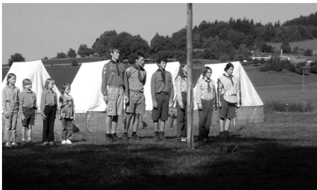
Nástup – v pozoru čekání na vytažení vlajky

Příprava je všem oznámena písknutím píšťalky písmene P v Morseově abecedě, a tak o ní ví každý. Probíhá to asi tak, že si uklidíme spacáky do stanů, zavřeme je, zkontrolujeme jestli někde něco neleží, a hlavně se převlečeme do krojů. Tedy nepředstavujte si žádné barevné sukne s pentlemi, jde samozřejmě o skautský kroj, tedy košili, kalhoty, klobouk, šátek s uzlem, ... Vyjdeme ze stanu a čekáme na signál ( opět hvízdnutí písmene, tentokrát N ). Pak už v největší tichosti nastoupíme na svá místa okolo stožáru a čekáme v pozoru, až vedoucí tábora pobídne vlajkovou četou, aby vztyčila vlajku České republiky. Pak přijde zahájení (zaseknutím sekýrky do špalku před stožárem), při kterém se dozvíme, co bude tento den na programu. CNS má připraveny aktivity a seznámí s nimi zbytek tábora. Dnes je výběr z drátkování, střelení ze vzduchovky a tancování. Po nástupu a převlečení z kroje se menší děti přesunou k aktivitě kterou si vybraly. Po svačině, která bývá okolo půl jedenácté se při aktivitách vystřídají a tak tráví čas až do oběda. Dojedením poslední lžice z ešusu začíná polední klid. Za parných dnů si každý vezme karimatku a jdeme do lesa, kde je chládek rozhodně příjemnější než ve stanu, na který celý den praží sluníčko. Program na polední klid si každý nadiriguje sám. Někteří si povídají, jiní píší dopisy či deník a denice (služba, družinka, která se celý den stará o kuchyň) domývá