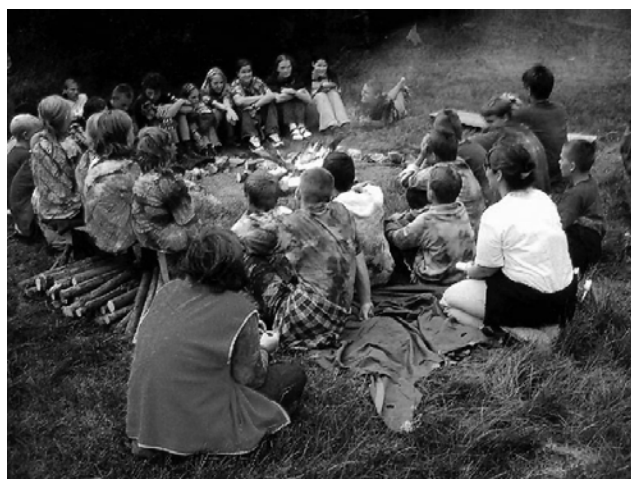
Okolo ohně – sesednutí večer okolo ohně má vždy své zvláštní kouzlo