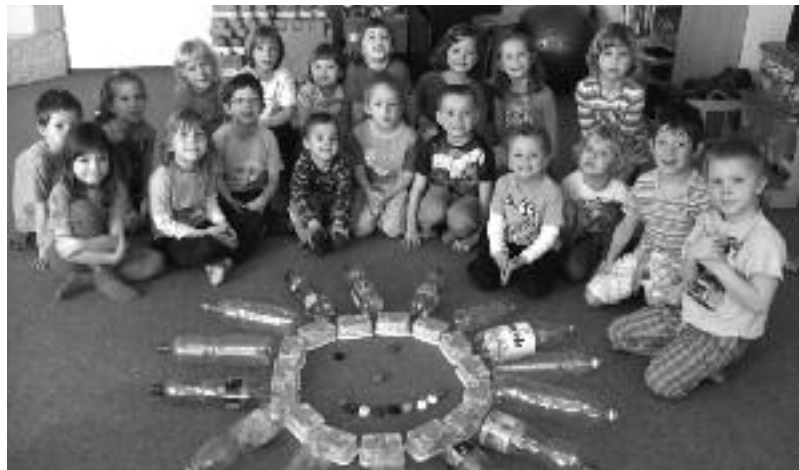
Za Mateřskou školu Sluníčko, Polesná 1690, Praha 9, kolektiv MŠ

Děti se zapojily i do úklidu školní zahrady. V dubnu pravidelně pracujeme s různými knihami, encyklopediemi, prohlížíme si tematicky zaměřenou literaturu a povídáme si s dětmi o tom, jak planetu chránit, aby se nám na ní hezky žilo. Proto si každý den paní učitelky s dětmi v ranním kruhu přečetly kapitolu z knihy ekologické výchovy pro děti, povídaly na dané téma a snažily se, aby všechny děti byly vtaženy do problematiky ochrany planety a zároveň si o tom povídaly doma v rodinách s rodiči a sourozenci. Týden pro planetu Zemi se stal v naší mateřské škole dobrou tradicí.