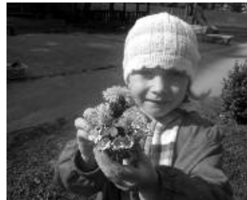
Kolektiv MŠ Rohožník

Tímto naše snaha nekončí, odstartovala se další akce s dětmi i rodiči. Malý citát nakonec: „Bud' zemi andělem, ona ti bude rájem.“