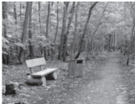
V lese se objevily nové lavičky