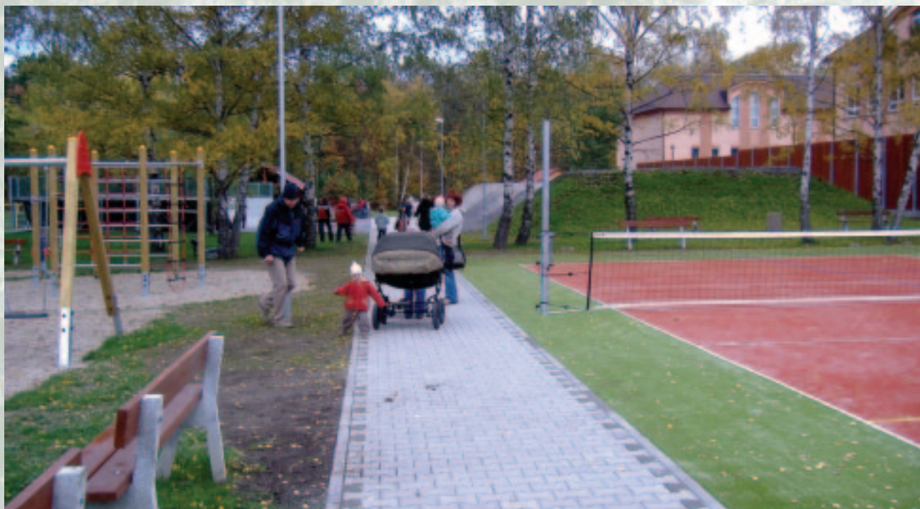
Multifunkční hřiště za školou už je v provozu.