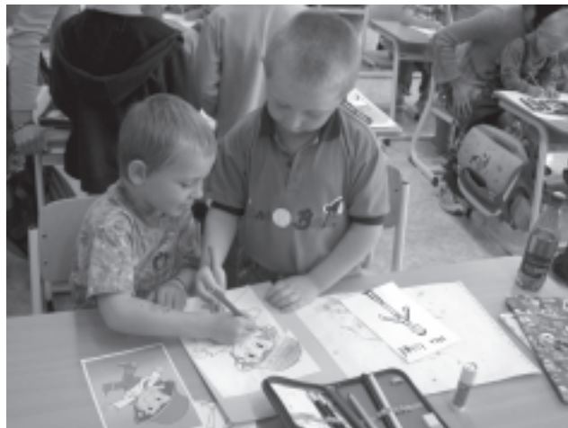
Děti z mateřské školky a školy našly společnou řeč

ního vzdělávání, prevence proti šikaně, upevňování mezilidských vztahů, usnadnit dětem jejich další životní i vzdělávací cestu, vychování člověka, schopného orientovat se na skutečné hodnoty.