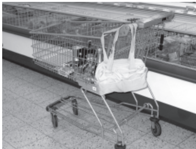
taška opuštěná na nákupním vozíku je pro zloděje snadnou kořistí

Podstatou této kriminality je skutečnost, že zákazník se zaměří v inkriminované chvíli na vlastní směr. Přes stále se zlepšující elektronické prostředky prevence, umístěné v daných provozovnách, není jednoduché předvídat z chování nakupujících budoucího pachatele či jej dokonce odhalit.