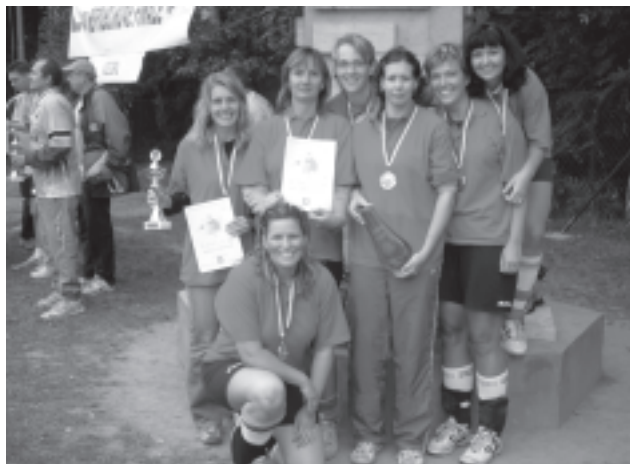
Družstvo si přivezlo z Dřevěnic opět zlatou medaili