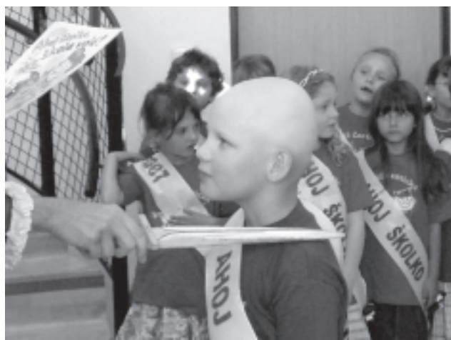
Pasování předškoláků je velká událost