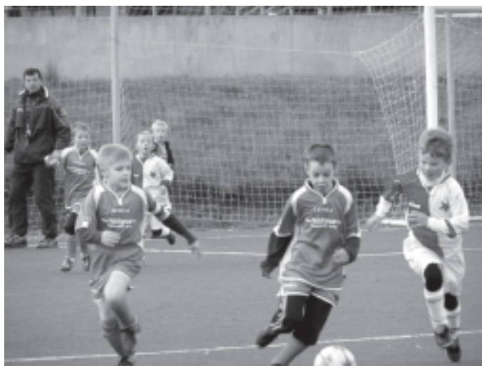
Utkání Újezd nad Lesy a Slavia, kde jsme zvítězili 3:2

SESTAVA: PŘIBYL-MESJAR, PINKAS M., VOJÁČEK-DRDLA, KONEJL-ŠULEK, LIPÁR STRÍDAČKA: NOVOTNÝ, MRUVČINSKÝ, BOUŠKA, PINKAS L., ŠULEKOVÁ