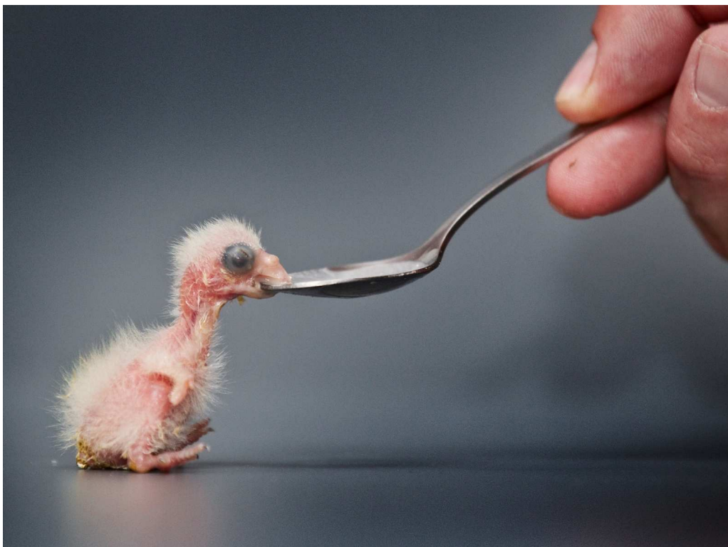
Ptáče v péči chovatelů prospívá.