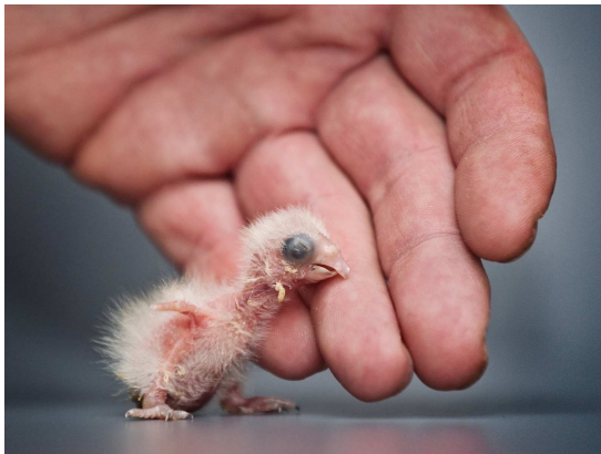
Po vylíhnutí vážilo mládě pouhé 3 g.

Loríčkové jsou v zoologických zahradách chování zcela výjimečně. Jde o potravní specialisty, kteří se živí nektarem a měkkými plody. Nektarožraví lorícci a loriové jsou chovatelským jádrem kolekce papoušků Zoo Praha. Chovatelsky patří k nejobtížnějším druhům.