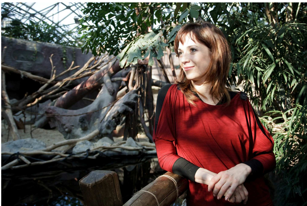
_TTT6720 – Tereza Kostková vyrazila do Indonéské džungle.

Mawar se však nadále po většinu času ukrývá v hnízdě vybudovaném pod kamennými oblouky v zadní části ostrova a spatřit ji s potomkem vyžaduje velké štěstí. Mawar stresuje především zvýšený hluk, v pavilonu je proto nutné chovat se tiše.