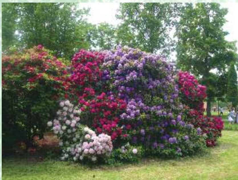
Kvetoucí rododendrony v parku u ZŠ Masarykova