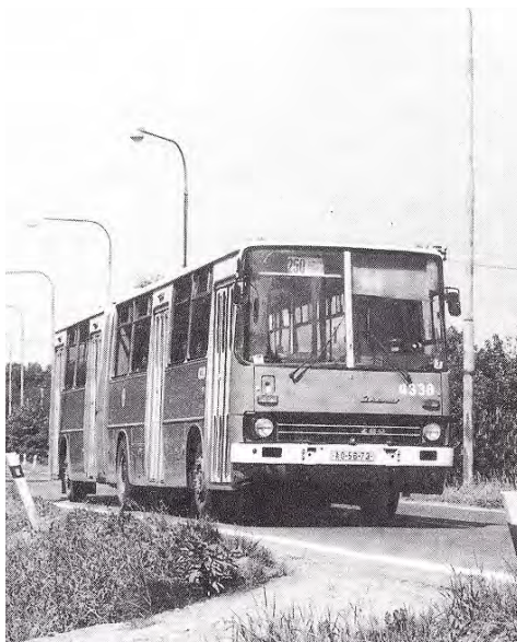
Foto autobusu je převzato z publikace Pražský dopravní zeměpis.

A jak to bude s Prahou dál? Přestože se počítalo s tím, že další rozšíření přijde kolem roku 1990, metropole se už nezvětšila a rozlohou zůstala na dnešních 496 km čtverečních. Což je na evropské hlavní město celkem dost. Pro představu: je to polovina Berlína, o něco více než Vídeň, a dokonce čtyřnásobek Paříže (ta ale zůstává v hranicích z roku 1860). Praha nejenže už neporoste, ale tu a tam se objevují snahy některých městských částí o odtržení. Naposledy o tom v roce 2016 uvažovalo Jižní Město (Praha 11). Návrhy na to, jak se stát samostatnou středočeskou obcí, ale nakonec narazily na nevíli většiny zastupitelů.