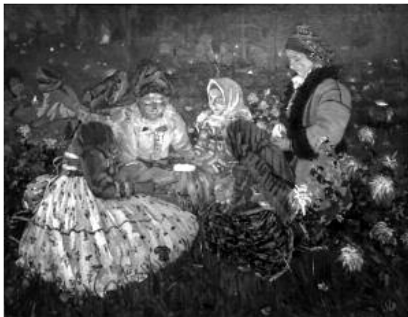
Joži Uprka - Dušičky