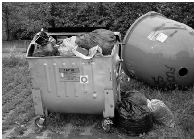
Separace v Čentické ulici

Mimo jiné toto stanoviště bylo asi před dvěma měsíci zapáleno.