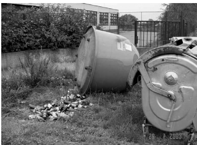
Separace v Čentické ulici