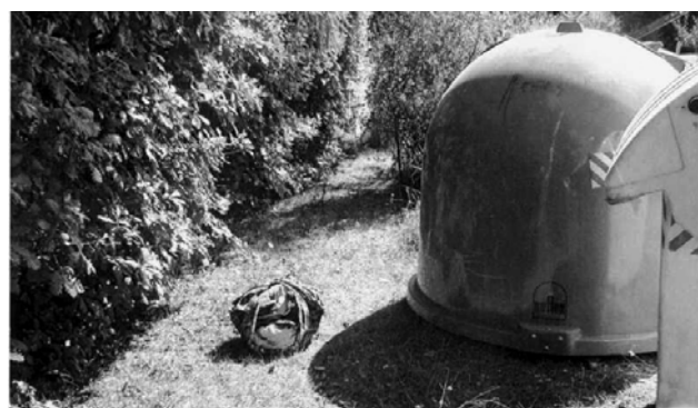
Roh ulic Hulická a Valdovská