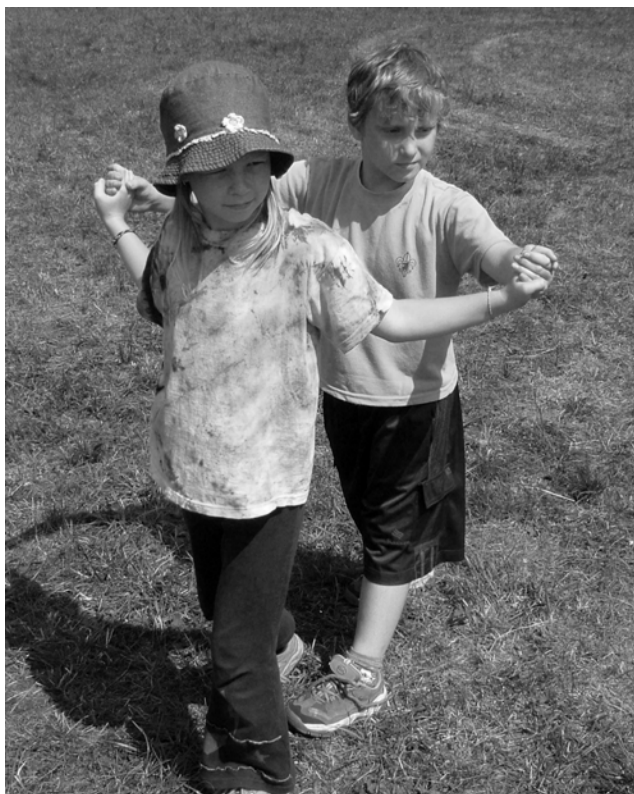
Tančíme – Dopolední aktivita „tancování“. I nejmladší účastníky tábora jsme nadchli mazurkou.

rozdělení po celou dobu tábora. Soutěžilo se v běhu na lyžích, v biatlonu a v hokeji a to snad za nejpárnějšího dne tábora, ale to našim závodníkům vůbec nevadilo. Během tábora jsme poznávali i okolí díky celodenním výletům. Navštívili jsme Svatobor, Mokřady, zámek Velhartice,... A po večerech jsme se scházeli u táborového ohně. Takhle by asi vypadalo shrnutí tábora jen v několika bodech.