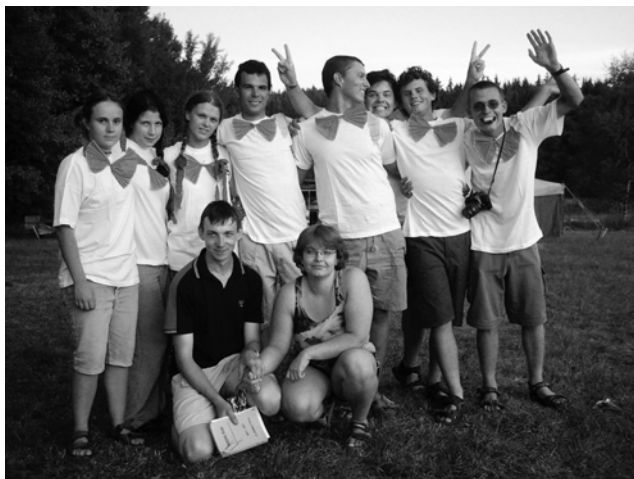
Naše elita – CNS (bez Dráčka), i takhle se dá bláznit na Kastrolovy 25. narozeniny

Představím vám jeden takový typický táborový den, který nebyl ani výlet ani olympijské hry a ani nic nějak zvláštního: „Představte si, že ležíte na posteli v podsadovém stanu, jste až po poslední vlas přikrytí spacákem a tiše si podřimujete.