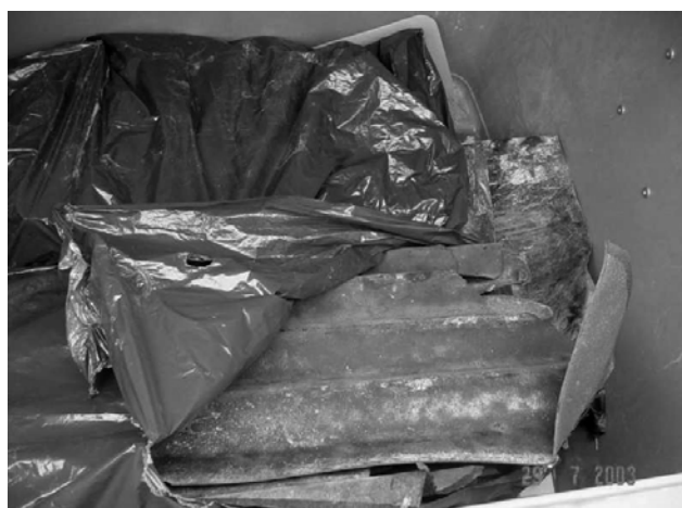
Separace v Čenovické ulici

Ale abychom popojeli dále o stanoviště níže do ulice Čenovické. Tam jsou umístěny dva kontejnery, na kterých je napsáno, že jsou na papír. Co myslíte, že jsem tam našla? Nebude vás dlouho napínat, byl tam jeden kontejner zaplněn do poloviny eternitem. Nevím, jestli všichni víte, že eternit je druh nebezpečného odpadu, a proto by se měl odkládat speciálními firmám, které mají oprávnění nakládat s tímto odpadem.