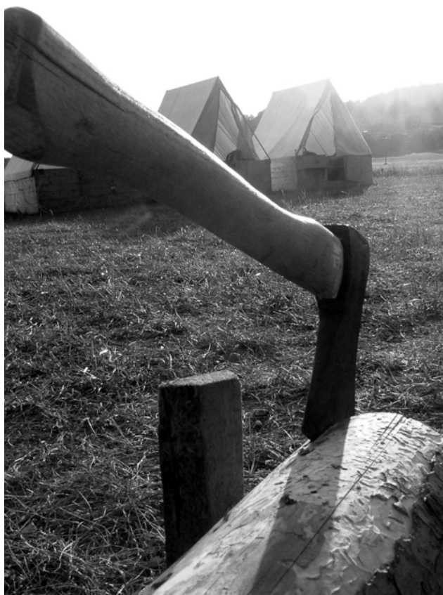
Zátíší – sekera zaseknutá – den zahájen

Náhle z dálky slyšíte hrát jemnou tichou melodii kytary a s ní text písně, kterou nerozeznáváte. To už se rozkoukáváte a slyšíte Štaflete s Hurvajsem jak odloží kytary a berou si do rukou pokličky. Začnou řvát budíček a to už nejméně polovina tábora nadává na strašný randál. Do pěti minut se všichni ocitají na náměstíčku a rádce si kontroluje svou družinu, jestli má všechny členy již vzhůru a nastoupené. Bič – jeden ze starších, který ten den dohlíží na normální chod tábora podle rozvrhu dne, má nachystanou rozcvičku a začíná se cvičit. Není to nějak fyzicky náročné, jen takové