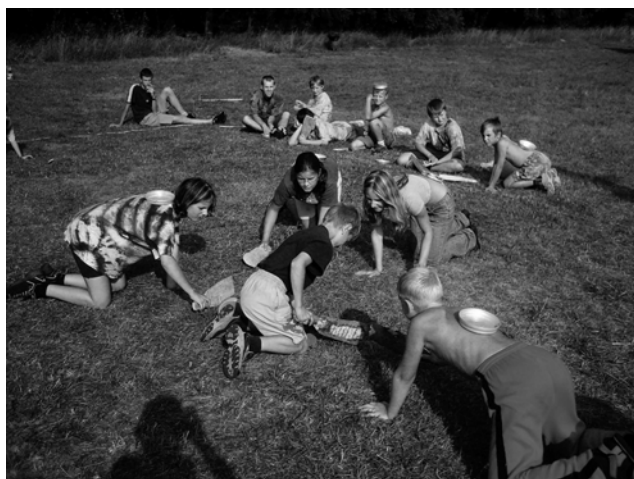
Hokej – Tak i takhle se dá hrát hokej v létě

O víkend nám přijeli se stavbou pomoci rodiče, újezdský šerif a jeho pravá ruka (tedy pan starosta s rodinou a paní tajemnice, kterým tímto moc děkujeme). Během víkendu se podařilo postavit všechny stany, hangár, proviantní stan