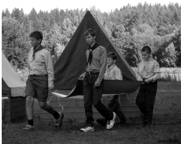
Vlajka na nástup – vlajková četa nesoucí vlajku ke vztyčení

Náhle z dálky slyšíte hrát jemnou tichou melodii kytary a s ní text písně, kterou nerozeznáváte. To už se rozkoukáváte a slyšíte Štaflete s Hurvajsem jak odloží kytary a berou si do rukou pokličky. Začnou řvát budíček a to už nejméně polovina tábora nadává na strašný randál. Do pěti minut se všichni ocitají na náměstíčku a rádce si kontroluje svou družinu, jestli má všechny členy již vzhůru a nastoupené. Bič – jeden ze starších, který ten den dohlíží na normální chod tábora podle rozvrhu dne, má nachystanou rozcvičku a začíná se cvičit. Není to nějak fyzicky náročné, jen takové