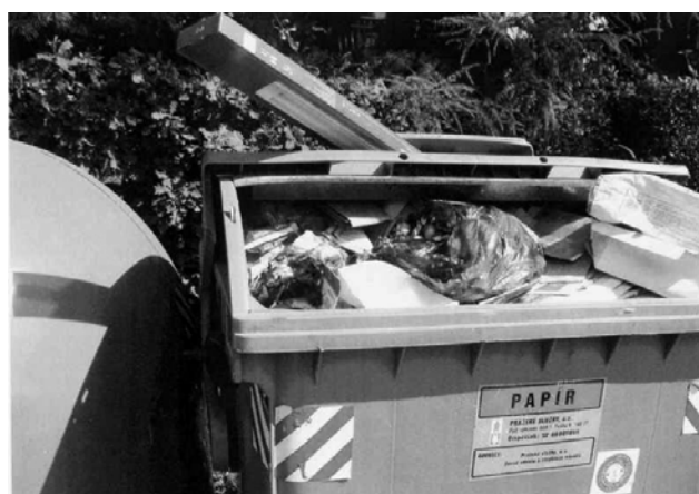
Roh ulic Hulická a Valdovská