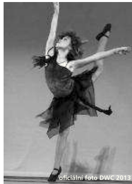
oficiální foto DWC 2013

Více informací na našich stránkách www.arabeska.cz , nebo na Facebooku. D. Poková a Z. Zafarová, Arabeska