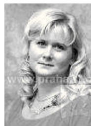
pečovatelka – obědářka