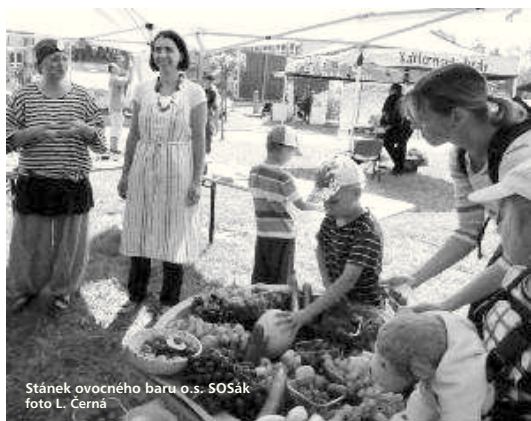
Stánek ovocného baru o.s. SOSák