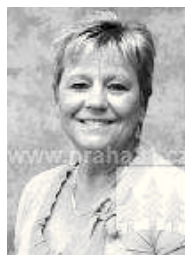
pečovatelka – obědářka