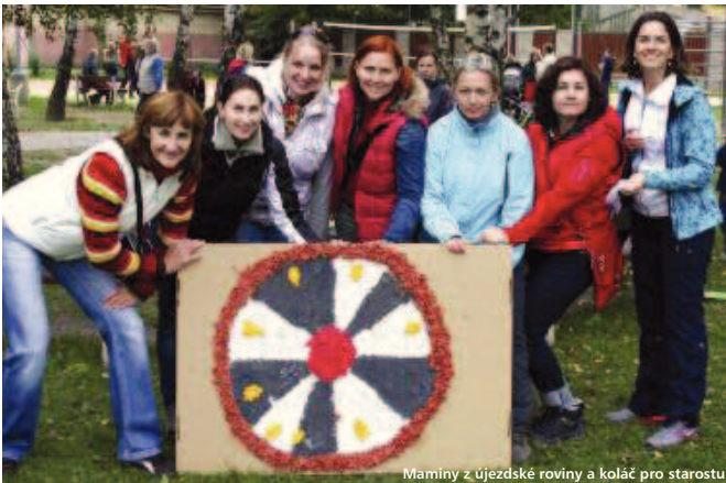
Maminy z Újezdské roviny a koláč pro starostu

Městská část Praha 21 ve spolupráci s o.s. Maminy z Újezdské roviny pořádala 14. 9. Újezdské posvícení. Na uvítanou hosté dostali posvícenský koláček. Maminy z Újezdské roviny připravily řadu zajímavých aktivit. Kdo z dětí se zúčastnil, dostal korálek jako odměnu. Děti, mohly nasbírat pro maminku deset korálků a navíc si osladit život koláčem z pekařství Domacukroví. Rodiče i děti společně vytvořili obrovský posvícenský koláč pro starostu.