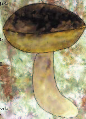
Obrázek Kristýna Dvořáková, báseň Lucie Černá