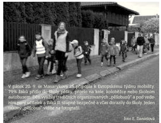
V pátek 20. 9. se Masarykova ZŠ připojila k Evropskému týdnu mobility. 79% žáků přišlo do školy pěšky, přijelo na kole, koloběžce nebo školním autobusem. Děti využily tradičních organizovaných „pěšobusů“ a pod vedením paní učitelky a žáků II. stupně bezpečně a včas dorazily do školy. Jeden takový „pěšobus“ vidíte na fotografii.