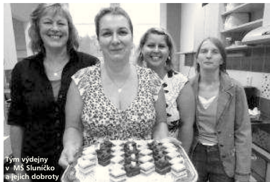
Tým výdejny v MŠ Sluníčko a jejich dobroty

Ředitelky školek si svorně pochvalovaly spolupráci s místním Úřadem a rodiči: NK: „Od Úřadu bylo velkorysé, že nám dal důvěru a světlé peníze na vybavení třídy. My jsme pak mohly vybavit školu přesně podle potřeb předškolních dětí. To víte, bylo s tím dost práce, ale výsle-