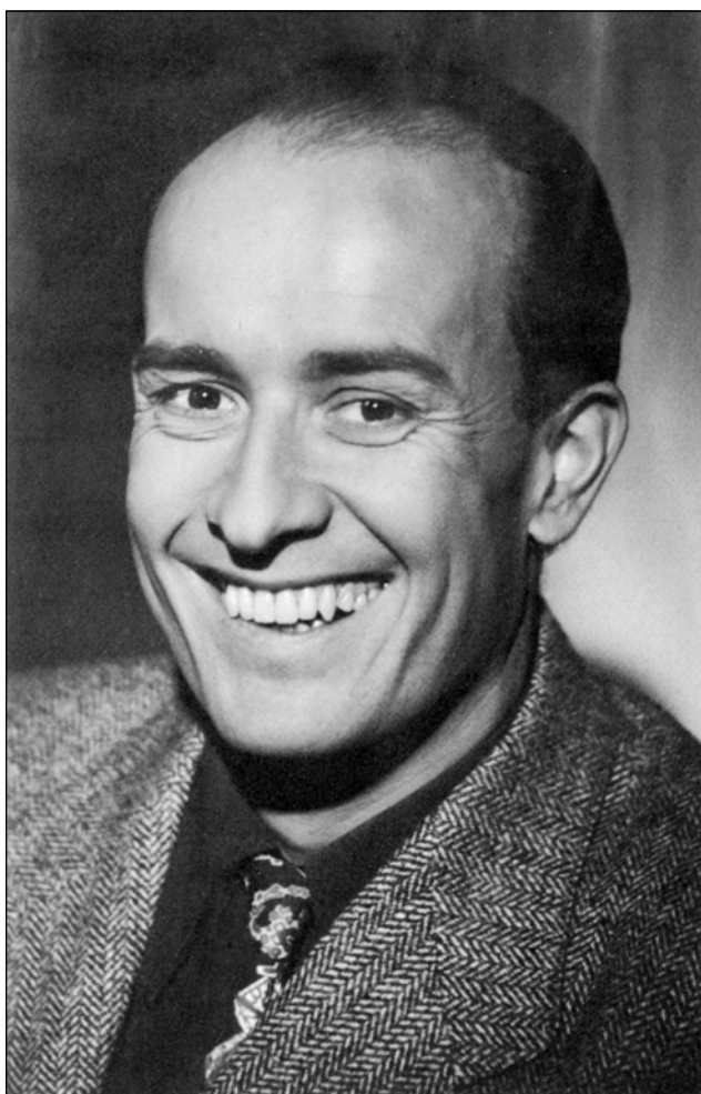
Jiří Voskovec, asi 1947

ale potřebuje vydělat na cestu za svou láskou Simonou Mainovou, a tak si zahraje v první „Pohádce máje“ pod pseudonymem Petr Dolan. Tímto filmem ale porušil stanovy amatérského spolku a je z Devětsilu vyloučen. V roce 1927 ale v devětsiláckém Osvobozeném divadle uvedou V+W své první dílo „Vest Pocket Revue“, které má úspěch a umožní Voskovcovi jednak cestu za lás-