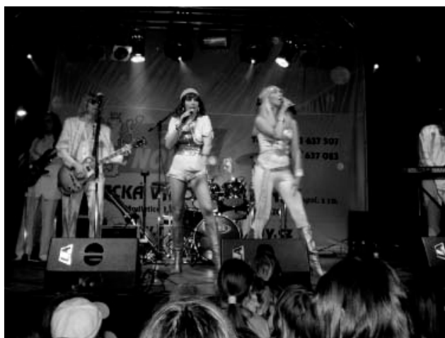
Skupina ABBA revival