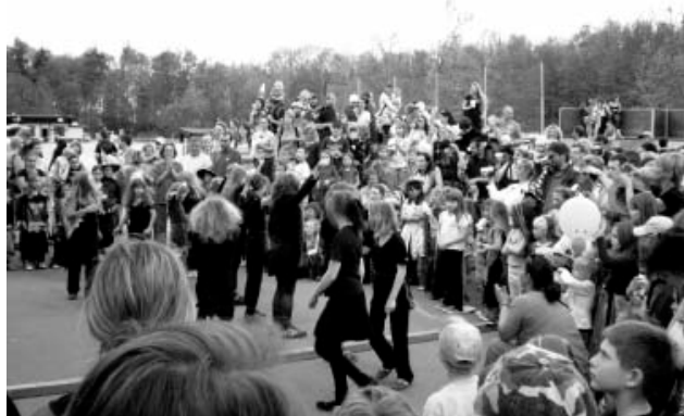
Davy návštěvníků na letošních čarodějnicích