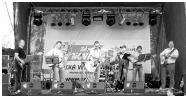
Újezdská skupina BOUDAŘI