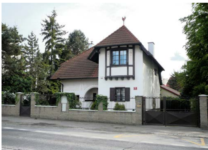
Dům Bergerových čp. 59

Pokračujte dál stejným směrem asi 200 metrů až k oranžovému domu se čtyřlístkem. Po jeho levé straně vidíte v původně veliké zahradě větší dům čp. 132 , kde bývala v roce 1949 zřízena ve dvou velkých místnostech MUDr. Šůrové mateřská škola. V roce 1961 byla budova vyvlastněna a po roce 1989 vrácena majitelům, ale školka tady byla v nájmu až do roku 2005. Později byla zahrada rozdělena na nynějších 5 pozemků.