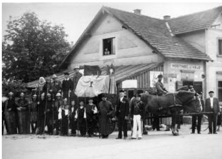
Stejné místo v roce 1936 - baráčníci před restaurací U Háje