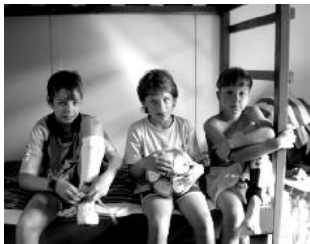
Příprava mladších žáků na trénink....

Tímto chceme poděkovat všem zúčastněným za dobrou reprezentaci naší obce.