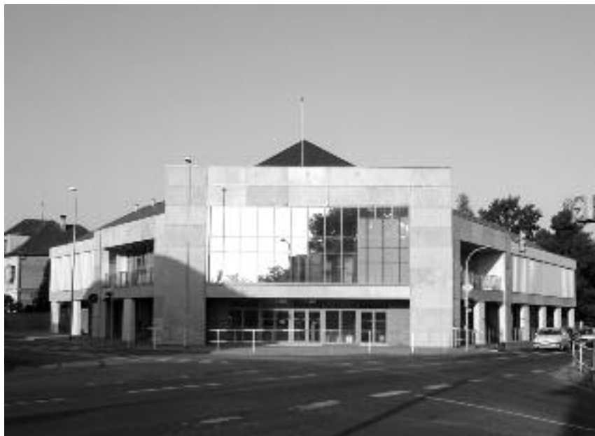
Polyfunkční dům v roce 2009

„Dopředu jsme věděli, co chceme. Tedy polyfunkční dům v centru, jehož některé prostory budou sloužit původním účelům. Chtěli jsme, aby byl v objektu společenský sál se zázemím a restaurace. Protože jsme začali se stavbou skoro sto let od výstavby původní budovy, měli jsme ale požadavky pochopitelně i jiné