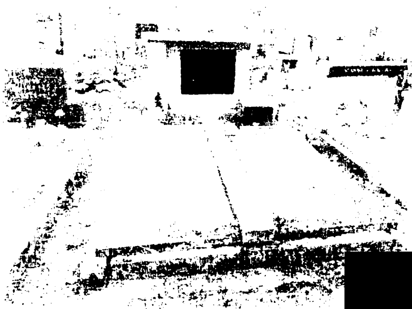
Střecha štítová - jezdecký ohrad. II, č.m. 13