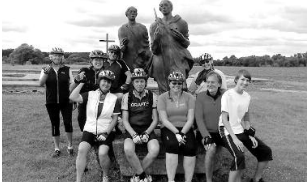
Foto: Na slovanském hradišti v Liblicích nad Cidlinou

Újezdští cyklisté „organizovaní“ při Komisi volnočasových aktivit mohou bilancovat II. ročník. Kvůli počasí se v sobotu 12. 5. neuskutečnil I. výlet na Klepec (který by měl být naší tradiční rozjíždkou před zahájením sezóny), ale ostatní výlety se jely a počet 10 přátel na kole se jeví jako optimální, třebaže i nadále voláme a lákáme další kamarády, kteří se chtějí s námi vydat na cesty. Kvůli termínům uzávěrek Zpravodaje můžeme jen spekulovat s tím, že i ten poslední výlet, 22. září, kdy se přesuneme vlakem do centra Prahy a poté poloprázdnou sobotní metropolí vyrazíme kolmo na Berounku a poté zpátky domů, že i tento vrchol naší sezóny dopadne příznivě.