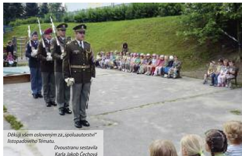
Děkují všem osloveným za „spoluautorství“ listopadového Tématu.

Podívejte se na nás na našich stránkách www.mscolesna.cz