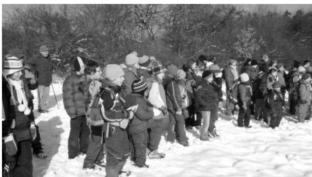
Naše Světlušky a Vičata na slavnostním nástupu

Děti už se těší na další ročník a sbírají nápady na nové nevšední Brděnkou.