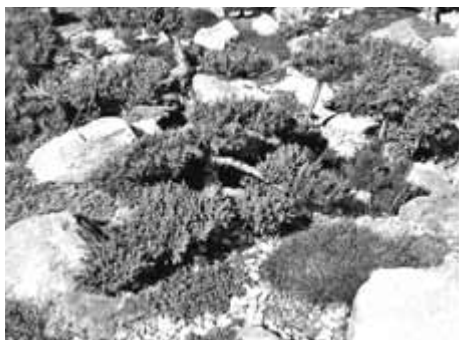
Čarověníky umožňují pěstování velkého počtu rostlin na malé ploše

V červnu je nejvhodnější doba na probírku plodů na jabloních, hrušních a broskvích po jejich propadu. Je to nepříjemná činnost, ale potřebná. Zlepšujeme tak velikost a zdraví plodů ale i stromů. Při protrhávání by plůdku měla zůstat na stromě stopka, tak se neporuší ponechané plody. Zastavil by se na určitou dobu jejich růst. Tuto probírku děláme buď ručně nebo nůžkami, kdy stopku od plůdku přestřihneme v polovině.