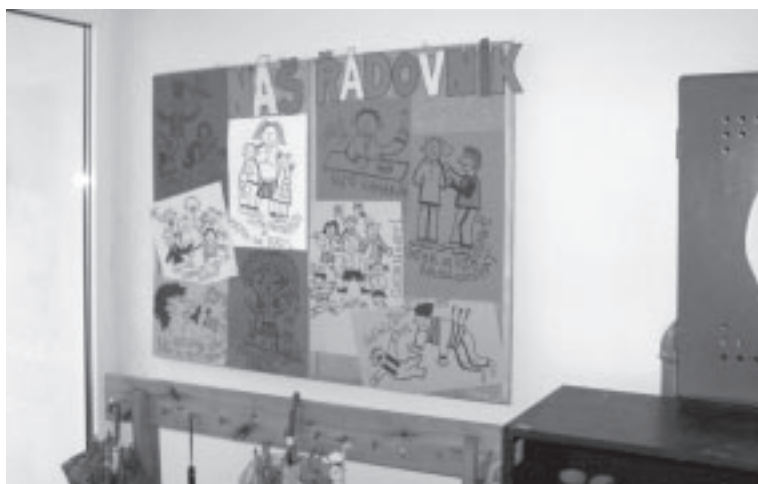
Děti ve školce vítají veselé i poučné obrázky