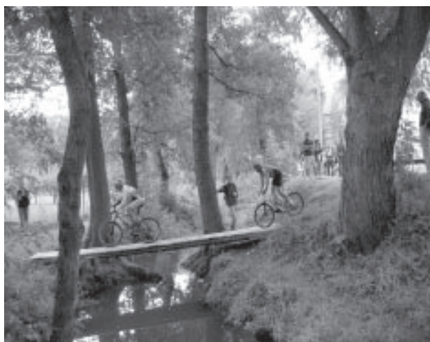
Do Úval se vrátil závod horských kol

Už je to hodně let zpátky co se v Úvalech jely závody horských kol naposledy. V sobotu 1.září se podařilo tuto tradici obnovit. Ti, kteří přišli na škvárové hřiště u kostela, nelitovali. Závod konaný pod záštitou starosty MUDr. Jana Šťastného byl zajímavý zejména kombinací dvou disciplín - Cross country (XC - závod na 4,9Km dlouhých okruzích) a Dirt Jump(triky na skokáncích).