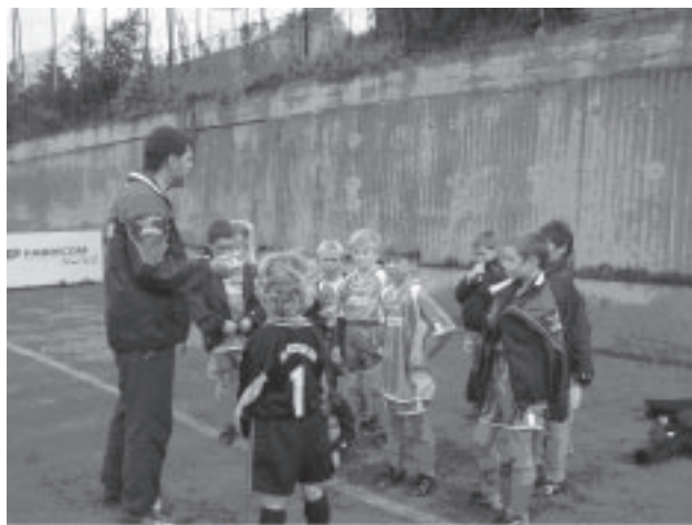
Porada o přestávce při zápasu Újezd - Tempo

Kluci i holky zahráli průměrné utkání, tak doufáme, že následující utkání proti Vyšehradu proměníme v zisk tří bodů, protože tentokrát jsme s výsledkem spokojeni nebyli.