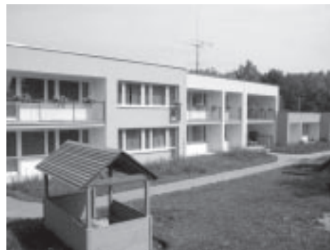
Nová barevná fasáda a vylepšené hřiště nejsou jedinými novinkami v mateřské škole na Rohožníku

Osobní svoboda a volnost dětí je respektována do určitých mezí, vyplývajících z řádu