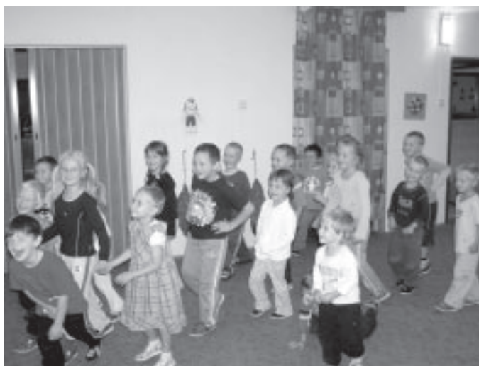
Děti se při hrách i mnoho naučí