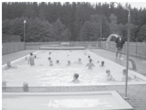
Na soustředění byl k dispozici i bazén

Na prvním utkání v Klánovicích proti 99' (!) jsme přijeli bez brankáře, a tak nám chytal střídající stoper. Než si zvykl na to, že může chytat i rukama, bylo to 0:6, ve druhé polovině utkání jsme dostali branky dvě. Druhé utkání, které jsme opět hráli proti 99' (z Točné) nakonec skončilo 0:4, přičemž v každé polovině jsme inkasovali 2 branky. Náš doposud nejlepší střelec branek se po 15 minutách zranil, a tak jsme se zatím gólově nijak neukázali. Přesto jsme byli, myslím, vyrovnaným soupeřem.