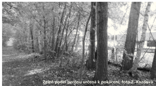
Zelení podél peronu určená k pokácení