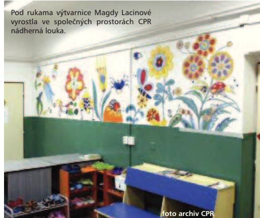
Pod rukama výtvarnice Magdy Lacinové vyrostla ve společných prostorách CPR nádherná louka.