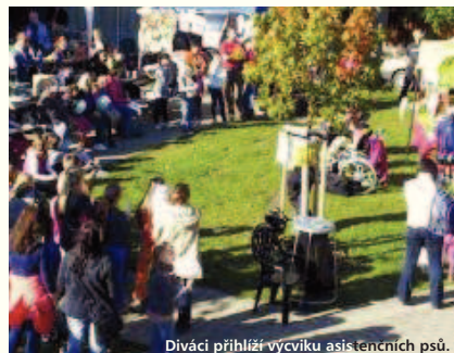
Diváci přihlíží výcviku asistenčních psů.