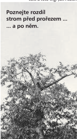
Poznejte rozdíl strom před prořezem ... a po něm.