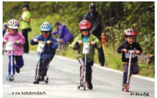
... a na kolobrnkách.