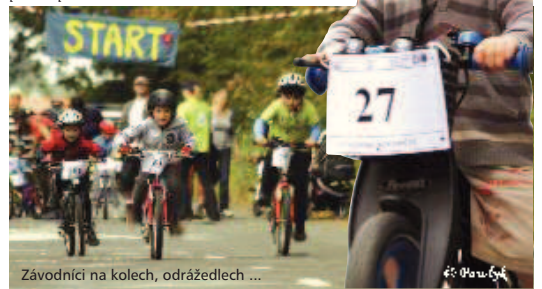
Závodníci na kolech, odrážedlech ...