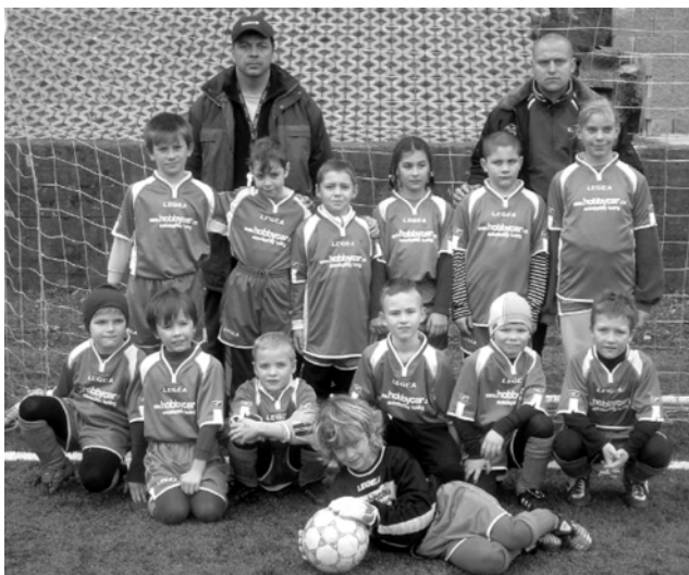
Foto z turnaje v Ústí nad Labem

Na turnaji, kde většina týmů měla soupisku složenou z hráčů ročníku 1998 jsme obsadili celkově 8. místo (z 10 účastníků). Protože náš klub nedisponujeme takovou členskou základnou, abychom na takovýto turnaj přivezli jen fotbalisty jednoho ročníku, museli jsme přivést hráče nejen ročníku 1998, ale i mladší a to až ročník 2000, takže i díky tomu jsme se nemohli fyzicky měřit s vyspělejšími soupeři, přesto jsme bojovali a dvě utkání se stavem 0 : 1 jsme prohráli až v samém závěru utkání po chybách obránců vzniklých z fyzického vyčerpání. Jako jediný tým jsme na turnaji měli i děvčata a to hned tři!! Tímto bychom chtěli klukům i děvčatům poděkovat za bojovnost a dobrou reprezentaci Újezda nad Lesy.