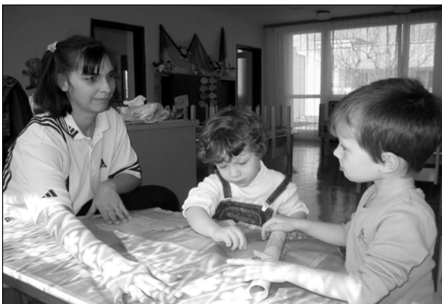
Děti se v rohožnické školce učí zručnosti

Aby nebyly pomíjeny i tělesné dovednosti, pravidelně cvičíme na balančních míčích, které děti znají pod pojmem „míče s ušima“ a které máme ve všech třídách. Oblíbenou sportovní činností předcházíme vzniku vadného držení těla, cíleně posilujeme, protahujeme a zařazujeme rovnovážné cvičení.