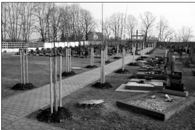
Původní stromy již ohrožovaly bezpečnost návštěvníků hřbitova

Ihned po vykácení bylo vysázeno nové oboustranné centrální stromořadí a dvě boční stromořadí z kultivarů vhodnějších pro hřbitovní výsadbu – lípy a javory s kuželovitou až sloupovitou korunou, aby ne-