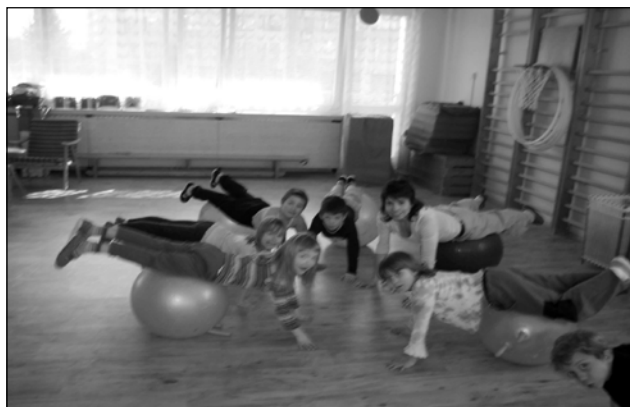
Cvičení na míčích děti baví

Já i moje kolegyně se snažíme, aby děti, které od nás budou odcházet na školy základní, byly vnímavé, ohleduplné, pozorné a samostatné. „Nikdo neví vše, ale každý víme něco ... a dětem to předáme...“