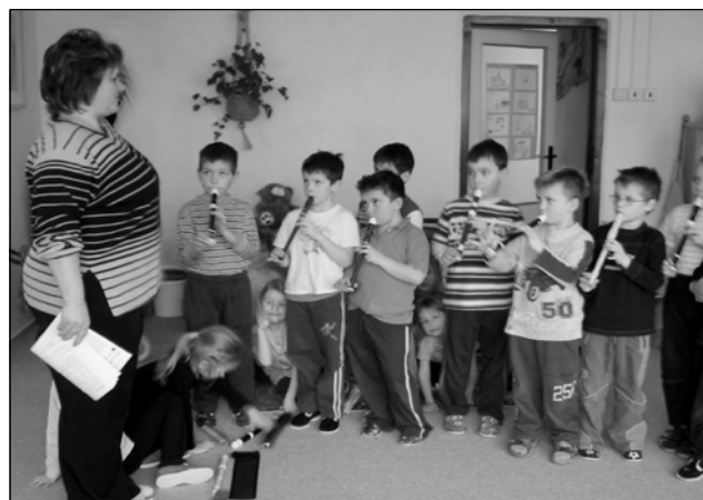
Ve školce na Rohožníku se hodně hraje a zpívá

K systematickému rozvoji dětských tvůrčích schopností nám však chybí keramická pec přímo ve škole. Je to finančně nákladné vybavení, ale zúročení ve spokojenosti dětí i rodičů by stálo za to.