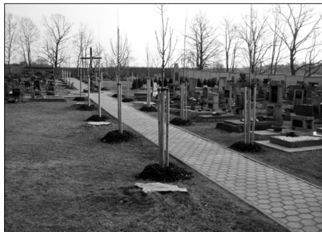
Staré nemocné stromy ustoupily nové výsadbě

Samozřejmě nedošlo jenom ke kácení stromů, ale i k nové výsadbě. Aby byl hřbitov i pro příští generace stále pěkný, vynaložil správce hřbitova nemalé úsilí k sehnání finančních prostředků na obnovu zeleně. Bez těchto finančních prostředků by k celému záměru nemohlo dojít.