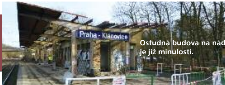
Ostudná budova na nádraží je již minulostí.

ÚZ pokračuje v elektronické verzi na www.praha21.cz