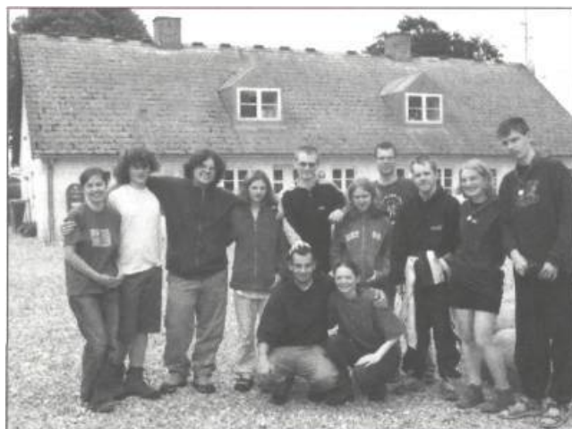
Společná fotografie se zahraničními dobrovolníky před odjezdem z Houens Odde

V sobotu už jsme se jen rozloučili a vydali se na třídenní cestu po Dánsku. Odpoledne jsme strávili v zábavním parku Djurs Sommerland a ani dešť nám nezabránil v tom, abychom si užili spousty legrace. Nejvíce nás asi bavila horská dráha, na které jsme byli asi pětkrát, ale ani jiné atrakce nebyly vůbec k zahození. Navštívili jsme například točící kotle, šlapadla, westernové městečko a spoustu jiných věcí.