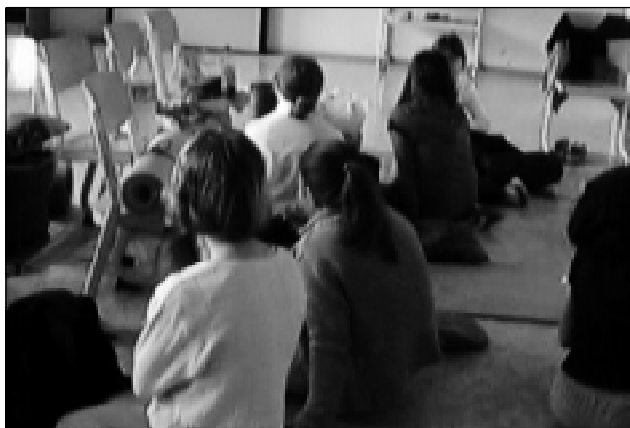
Všichni si po ránu balí své věci. A po úklidu následují hry. Jupití!