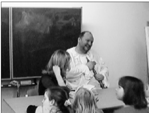
Při předčítání pohádek se děti určitě nenudily. Pohádky v podání pana krále totiž byly výjimečné.

18:00 – Tísníme se ve vstupní hale. Nikdo totiž nechce přijít o vystoupení Bambini di Praga. Následuje příchod paní královny Daušové a jejího chotě Veličenstva Šubrtů. Děti je se zatajeným dechem pozorují a naslouchají, aby jim nic neuteklo. Po tomto přijetí se děti rozprchnou do všech koutů školy. Někdo dal přednost čtení pohádek, jiný se připravoval na večerní vystoupení v divadle.