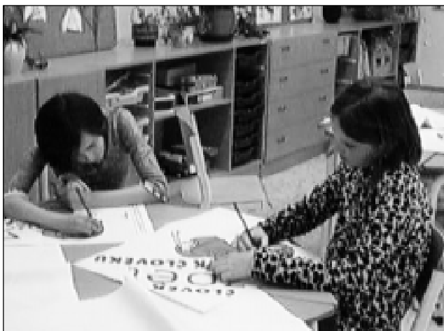
Někdo si v předem připravených třídách zahrál hry s malými míčky, někdo dal přednost kreslení.

19:00 – Všichni se spěchají do divadla, kde začíná vystoupení žáků z páté třídy. Připravili si pro nás Princeznu Koloběžku I. Představení se mi moc líbilo, žáci měli správné komentáře. Jde vidět, že se museli připravovat asi dlouho, protože odvedli skvělý výkon a potlesk v divadle to jen potvrdil.