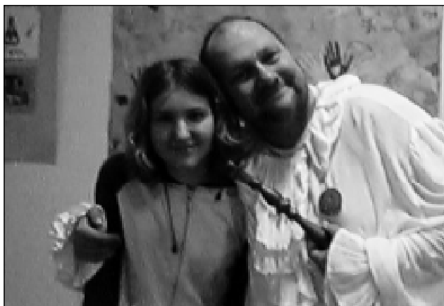
Také jsem si nemohla nechat ujít příležitost vyfotit se s Jeho Výsostí.

19:00 – Všichni se spěchají do divadla, kde začíná vystoupení žáků z páté třídy. Připravili si pro nás Princeznu Koloběžku I. Představení se mi moc líbilo, žáci měli správné komentáře. Jde vidět, že se museli připravovat asi dlouho, protože odvedli skvělý výkon a potlesk v divadle to jen potvrdil.