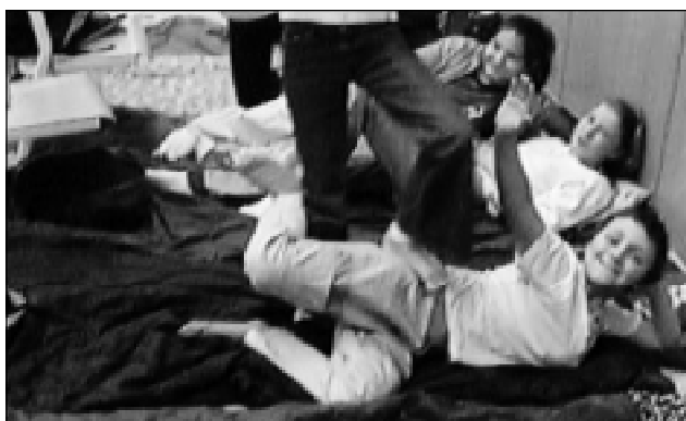
Tito „spáči“ rozhodně unavení nejsou...

Po představení rodiče odcházeli domů a my jsme si začali ve třídách připravovat spacáky. To trvalo jen chvíli, pak následovalo překvapení – vystoupení členů Divadla pod úrovní.