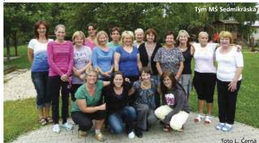
Tým MŠ Sedmíkráská

V Mateřské škole Sluníčko, která sídlí ve třetím patře Masarykovy základní školy v Polesné ulici, jsme zrekonstruovali skladové prostory na jednu třídu pro 22 dětí (v jedné s Magistrátem hl. m. Prahy je umístění 24 dětí). Děti v této mateřské škole musely chodit na oběd do školní jídelny, proto vybudováním dalšího prostoru, do kterého se jídla přivezou a připraví pro vydání, odpadnou přesyň děti na jídlo po budově školy. Mateřská škola má tak 4 třídy pro 106 dětí s výdejnou jídel.