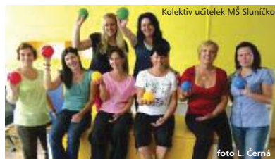
Kolektiv učitelky MŠ Sluníčko