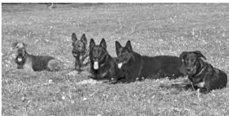
Společné odložení psů