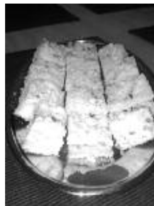
hrníčkový koláč je rychlý a chutná