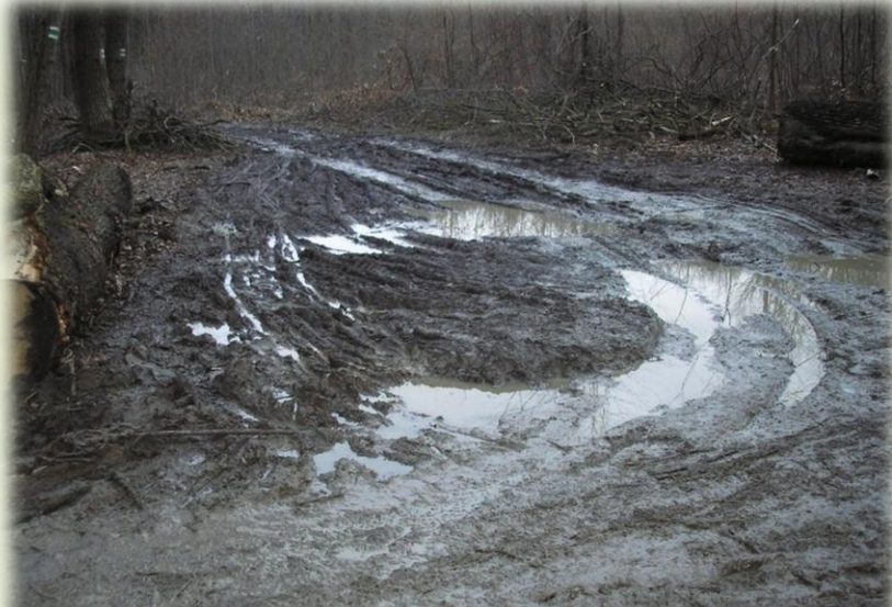
PONIČENÉ LESNÍ CESTY