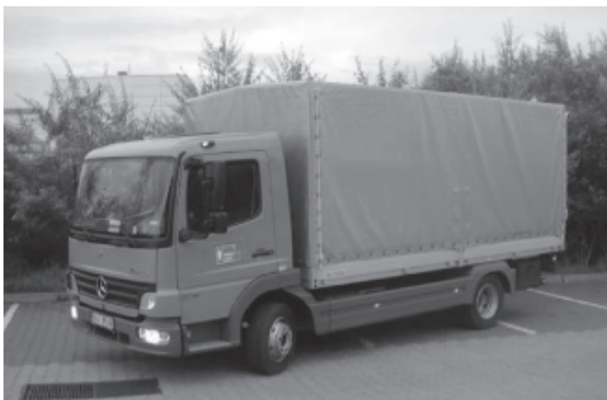
Vozidlo, které za poplatek odváží odpad do sběrného dvora