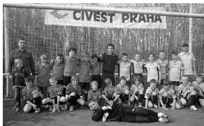
Na obrázku hráči starších přípravek