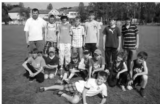
Na obrázku mladší žáci FK Újezd nad Lesy po turnaji